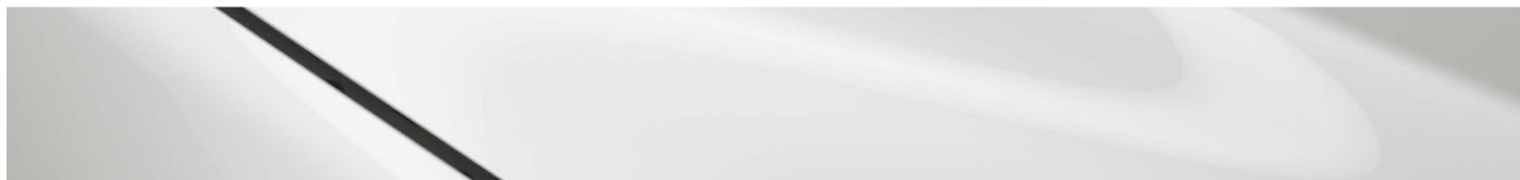
Blanco aperlado mica