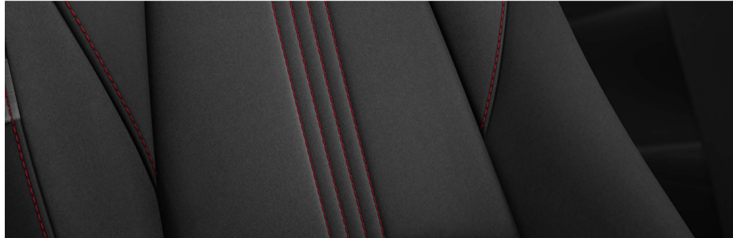
Versión i Sport