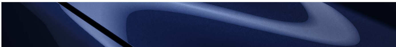
Azul marino profundo